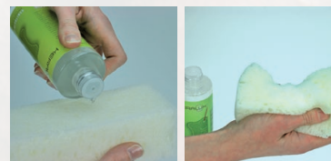
Auftragen des KERALUX® Sanftreinigers

So wie unsere Haut benötigt auch das Leder Ihres Polstermöbels eine regelmäßige Reinigung und Pflege, um weich und anschmiegsam zu bleiben und eine vorzeitige Alterung zu verhindern. Außerdem gewährleistet eine regelmäßige Reinigung und Pflege eine längere Farbbrillanz des Bezugsleders.