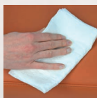
Auftragen des KERALUX® Sanfreinigers